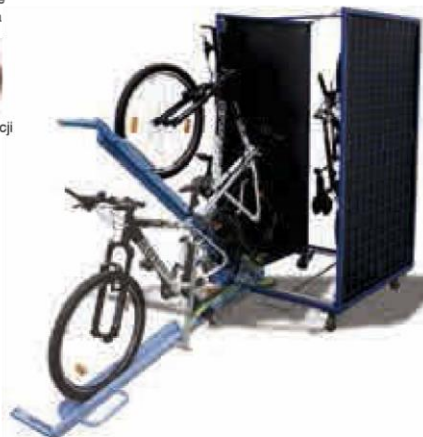
Regał do składowania piętrowego