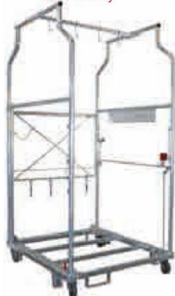
Box na rowery