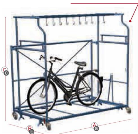
Corletta® rowerowa z płachtami przedzielającymi

Corletty rowerowe można nie tylko ustawiać piętrowo tak, jak wiele innych Corlett, lecz również istnieje przy nich możliwość 5-stopniowej regulacji wysokości. Dzięki temu pasują do nich zarówno rowery dziecięce, jak i te z 28-calowymi kołami. W Corletcie rowerowej mogą Państwo umieścić aż 10 rowerów.