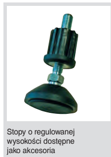
Stopy o regulowanej wysokości dostępne jako akcesoria