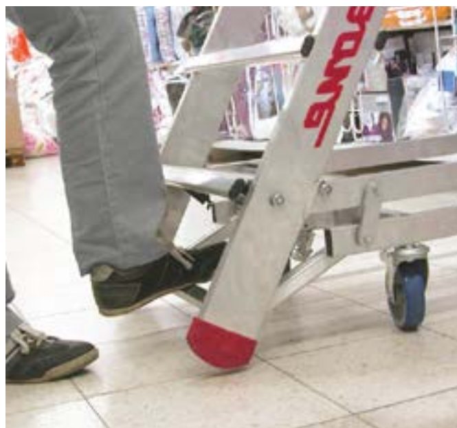
Zwalnianie blokady Realising the lock.