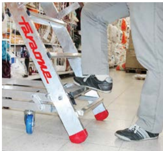
System automatycznej blokady drabiny. The automatic locking ladder.