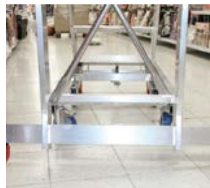
Masywny stabilizator. Massive stabilizer.