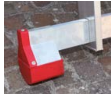
Nowa podstawa stabilizująca New stabilizer base