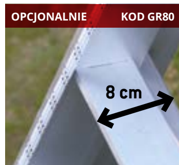
OPCJONALNIE KOD GR80 Stopnie o szerokości 8 cm 8 cm wide rungs