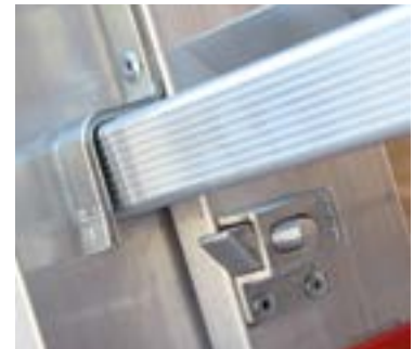
Specjalne zabezpieczenie przed wypięciem Special unhook safety device