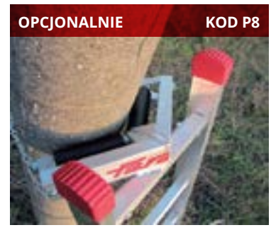
OPCJONALNIE KOD P8 Opcjonalne zabezpieczenie Optional pole support