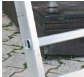
Szczęble 30x30 mm Rung 30x30 mm