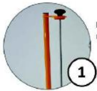
Pionowy dyspenser na folię do pakowania