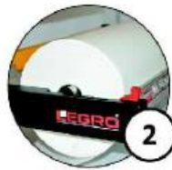
Poziomy dyspenser z ucinaczem na papier lub folię do pakowania