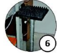
Stół do zszywania dna kartonów z gumową podkładką i regulowaną wysokością kolumn w zakresie 590-710 [mm]