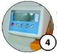
Waga /w trzech modelach/ - urządzenie ważące - waga z funkcją komputera - komputer z programem ważącym