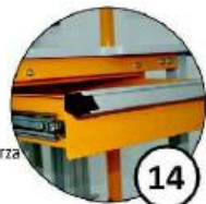
Szufłada na podręczne przybory /notes, nożyczki, nożyk, itp/