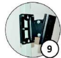
Uchwyt na monitor z możliwością regulacji śrub montażowych w trzech rozstawach: 50, 75, 100 [mm]