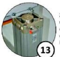
Zbiornik buforowy układu pneumatycznego o objętości 4 litrów w warunkach ciśnienia atmosferycznego; kompensuje krótkotrwałe braki powietrza