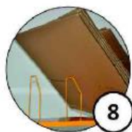
Półka z przegradami do sortowania kartonów wg rozmiaru