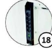
Listwa zasilająca przeciwzakłóceńowa 5-gniazdkowa 230V