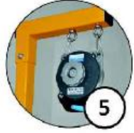
Balanser ze zintegrowanym przewodem pneumatycznym