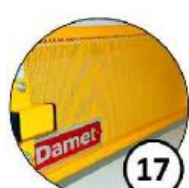
Błacha perforowana do zawieszania drobnych elementów