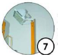
Ramię na wybrany element - oświetlenie - promiennik podczerwieni ogrzewający stanowisko pracy /do 9 m. kw. powierzchni/