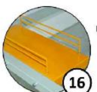
Półka na komputer stacjonarny