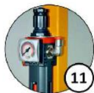
Filtr-reduktor ciśnienia /w opcji smarownicza/ umieszczony na wysokości wzroku użytkownika