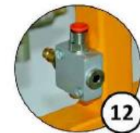
Kostka przyłączeniowa instalacji pneumatycznej; z możliwością montażu na różnej wysokości