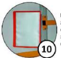
Ramka na dokumenty zapewniająca ochronę dokumentów przed zabrudzeniami oraz uszkodzeniami mechanicznymi